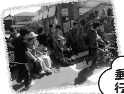
垂井祭りに行きました