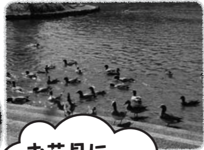
お花見に行きました