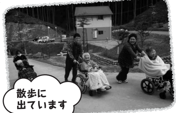
散歩に出ています

春先、気候も穏やかになり、入居者の方々と散歩にでかけました。施設の周りには季節の花々がたくさん咲いており、「いろんな花があるわね」「嬉しい始めて見る事が出来た、写真撮って」と楽しそうにお話をされてみえました。