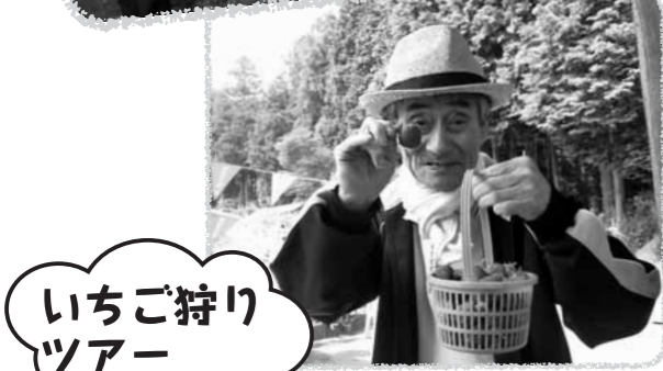
いちご狩りツアー

池の近くには野良猫が数匹おり「猫も寝そべって逃げてかへんわ、これはいい」と話してみえました。また芝生にシートをひいている方を見ては、「休憩するのにここはちょうどいい所やわ」と笑顔で話されていました。池には鯉やカモが沢山おり、花見と両方楽しんでいただけました。