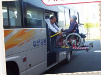
バスに乗り込んで遠足にしゅっぱーつ！

二日間に分けて、各務原の河川環境楽園へバスで出かけました。ご家族も参加され、お天気に恵まれてテラスで食べる食事もおいしくいただけました。アクアトトでは大きなカメやカビバラ、かわいらしいカワウソを身を乗り出して覗き込んでおられる姿が多くみられました。また、水槽をゆったりと泳ぐ魚に、目を輝かせていらっしゃいました。