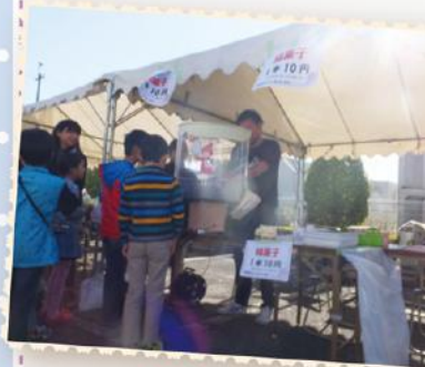
「わたがし屋」を出店しました。子供たちに大人気で、長蛇の列ができました。

毎年恒例となった「和合地区センター祭り」に今年も入居者さまの力作を出展しました。当日は秋晴れのお天気になり、みんなで作品展を観に行きました。よその施設や子供たちの作品も見てまわりました。