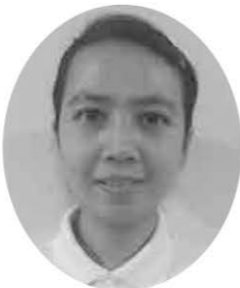
優・悠・邑 リズキ ウリ ダサリ

入居者様を私の両親のように思っています。介護をしていると入居者様を嫌な気持ちにさせてしまわないか私は緊張します。いろいろなことをしっかり受け止めて、心をこめて接していきたいです。これから親身になって入居者様を大事に、入居者様にとって良い介護ができるように頑張りたいです。入居者様がいつも笑顔で楽しく過ごしていただけるように頑張っていきます。介護福祉士の国家資格に合格出来るように頑張っていきます。