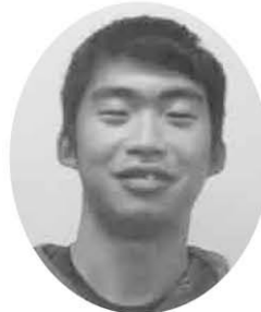
優・悠・邑 和合 西竹 流星

4月から社会人となり、働き始めて約3ヶ月が過ぎました。今も介護という職業が人手不足の中、少しでも役に立ちたくて、この職業へ就職しました。今は、シーツ交換、洗濯、記録などを行っています。この先、介護業務にも力を入れていこうと思っています。まだまだ覚えなければいけないこと、学ばなければいけないことがたくさんありますが、一人前の介護職員になれるように頑張ります。